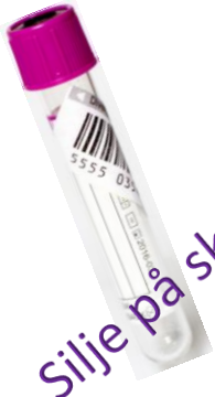
Silje på skeiva